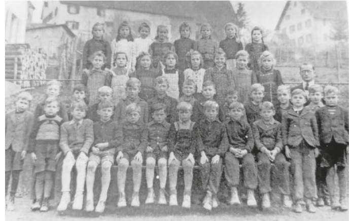
„Klassenfoto der 39er aus Hohentengen, Beizkofen, Bremen und Enzkofen, im Schulhof der damaligen Volksschule Hohentengen mit Blick auf die noch unbebaute „Halde“. Die Aufnahme stammt aus dem Schuljahr 1947/48 (= 3. Klasse). Das Foto wird in der Ausstellung mit Angabe der Namen gezeigt!