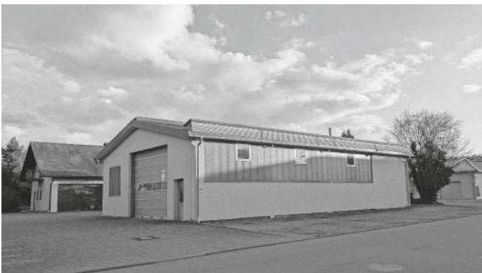
Die erste Produktions- und Werkstatthalle der Firma Stehle Metallbau

Nach der Meisterprüfung begann 1982 das „unternehmerische Engagement“ des „Jungunternehmers“ zunächst im Nebenerwerbsbetrieb , legal mit Eintrag in der Handwerkerrolle . Seine ersten Produkte waren geschmiedete Kerzenständer und Fenstergitter , die er in der elterlichen Garage in Ölkofen fertigte. Von dort aus machte er den Sprung zur teilweisen Selbstständigkeit , nachdem er 1987-1989 seine „ erste Halle “, sowie das Wohnhaus im neuen Gewerbegebiet „ Bachäcker “ erbaut hatte.