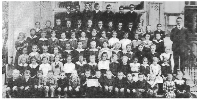
Die Schüler der Schulklasse in Völlkofen aus dem Jahr 1910. Nur zur optischen Verdeutlichung der Zahl der zu unterrichtenden Schüler unterschiedlichsten Alters in einem Klassenraum!

Quelle: Auszug aus SZ Bericht vom 23.8.1990, von Anton Kammerlander