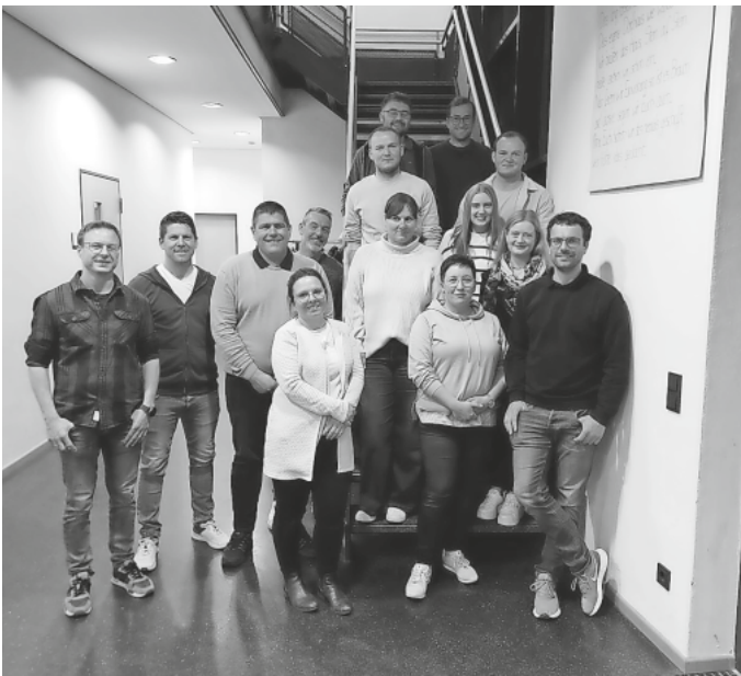
Die Vorstandschaft des HFNV Ölkofen e.V.