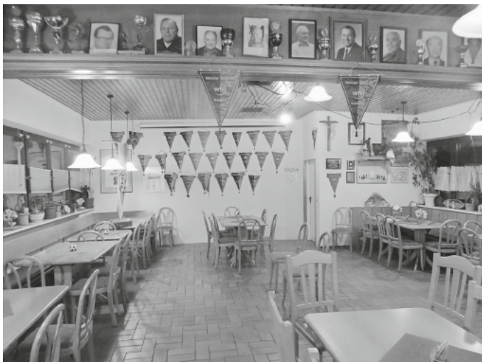
Eine schöne Geste, die Sieges-Wimpel der neuesten Siege (Triple) erhielten einen Ehrenplatz unter den Fotos der verstorbenen Sportler des SVH

Quellen: Jubiläumsfestschriften des SVH zum 40., 50. u. 75. Jubiläum, sowie zur Fahnenweihe 1964.