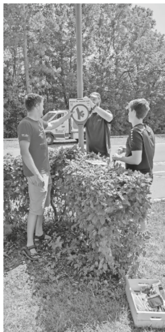
Bewegungshaltestellen werden aufgebaut