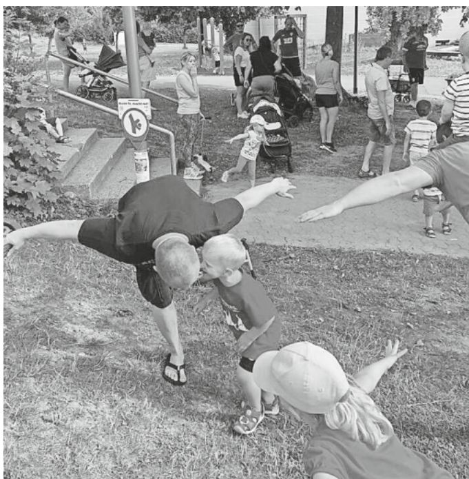
Bewegungshaltestellen: Eltern und Kinder in Aktion

Sie finden die Route mit den Bewegungshaltestellen unter: https://www.google.com/maps/d/edit?mid=13UVhkLkftFSDzrnQELOgAlBOd0Zhzls&usp=sharing