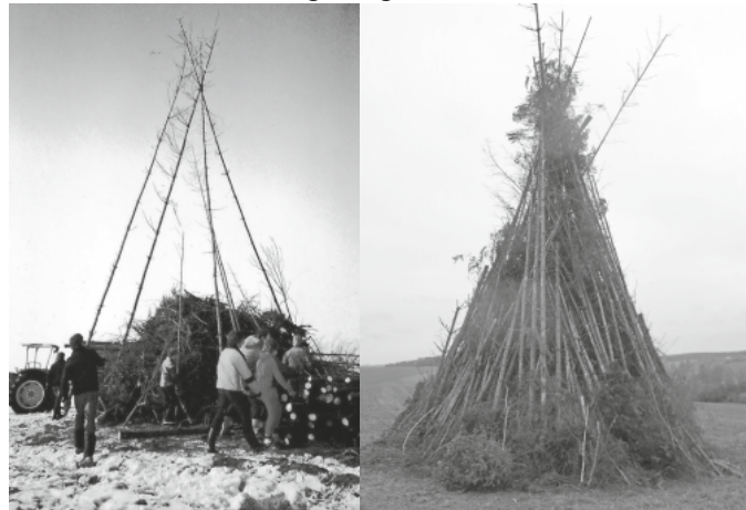
Entstehung eines Funken: links altes Foto von Günstkofen, rechts der fertige Völlkofer Funken

offiziell „flackern“. Das ist verständlich und nachvollziehbar, aber eigentlich schade, weil es früher ein sehr schöner, ja erhebender Anblick war, als, überall rundum die Funkenfeuer am selben Tag und zur selben Zeit gleichzeitig in die Nacht hinein aufloderten. Es war irgendwie etwas Besonderes, wenn man im Publikum Ausblick hielt: „Guck det d'r Bremer, d'r Ursadorfer, d'r Völlkofer, d'r Eichener, d'r Ölkofer, d'r Enzkofer, d'r Günstkofer ond – früher mal – d'r Dange-mer Funka“ und je nach Standort auch noch andere Funken in der näheren oder weiteren Umgebung leuchteten.