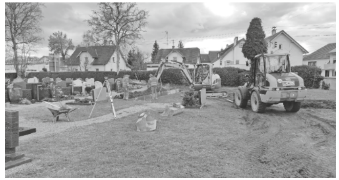
Die Bauarbeiten auf dem Friedhof haben begonnen

Im Dezember fasste der Gemeinderat den Beschluss zur Beauftragung des „Zweckverbandes Wegebaugerätgemeinschaft Albrand“ – sozusagen ein gemeinsamer Bauhof, der von den Mitgliedsgemeinden für besondere Aufgaben herangezogen werden kann.